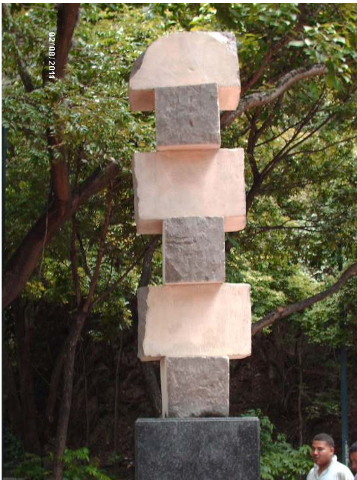
La Estela de Seis volúmenes, ya restaurada.